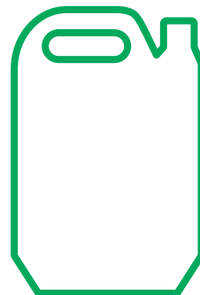
5000 ml kanister