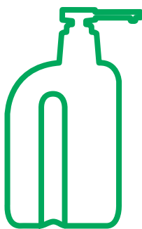
1000 ml pumbaga dosaatorpudel